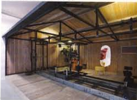
ATELIER VAN LIESHOUT, 'MANUFACTUUR', ZAALOVERZICHT